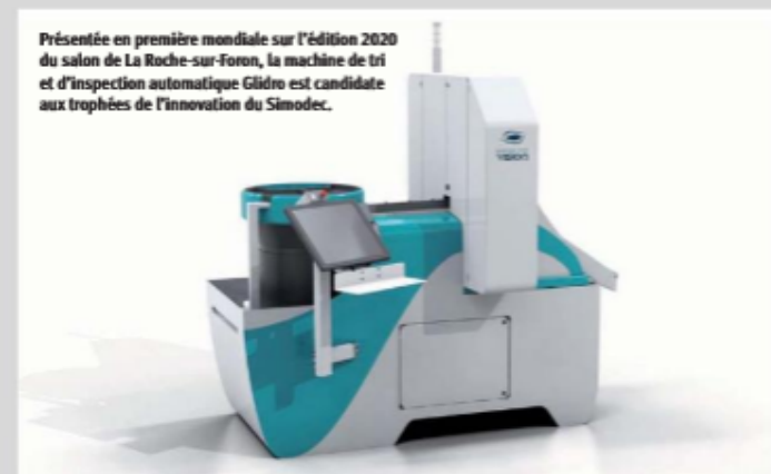
Présentée en première mondiale sur l'édition 2020 du salon de La Roche-sur-Foron, la machine de tri et d'inspection automatique Glidro est candidate aux trophées de l'innovation du Simodec.

Plusieurs fois lauréat des trophées de l'innovation du Simodec en catégorie mesure et contrôle-qualité, le constructeur français Expertise Vision présente en première mondiale sur l'édition 2020 du salon de La Roche-sur-Foron une nouvelle machine d'inspection et de tri. Baptisée Glidro, sa toute nouvelle solution d'inspection et de tri est basée sur un système de glisseur qui apporte précision, rapidité et polyvalence pour des pièces mesurées entre 0,5 mm et 120 mm.